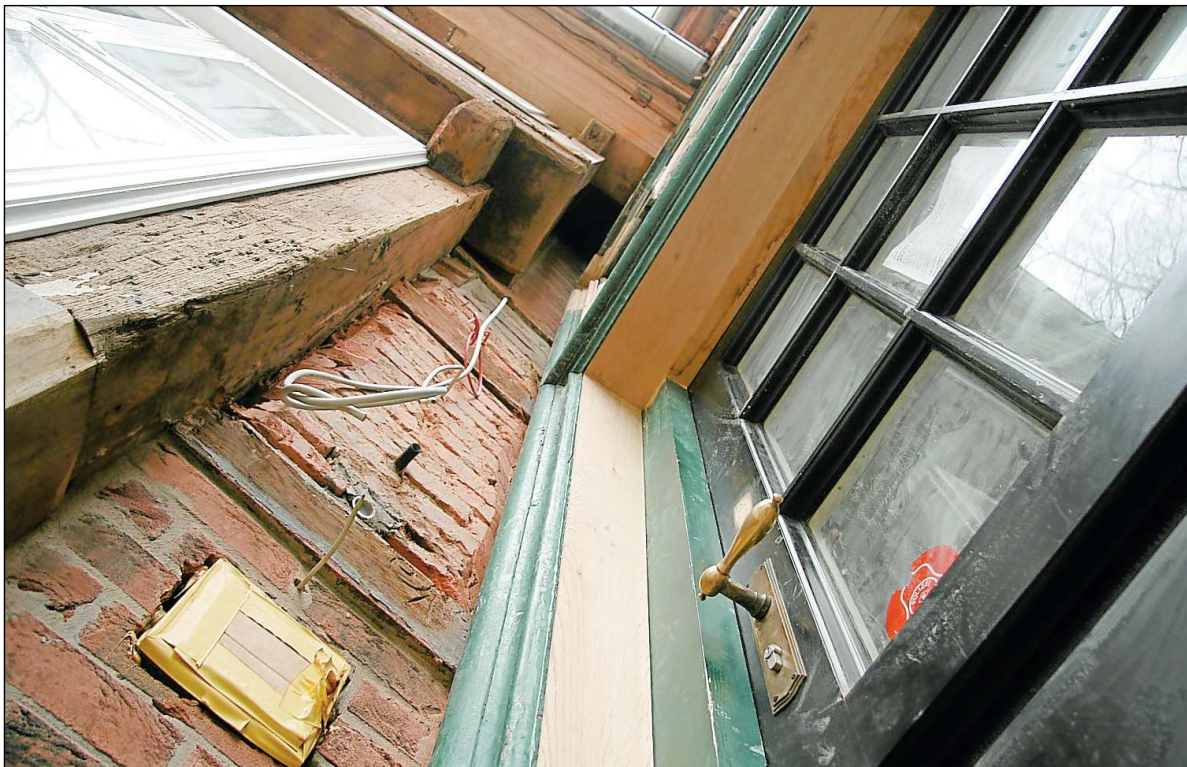
Die Sanierung des Veerhoffhauses an der Kirchstraße gehört zu den Investitionen, die im Haushalt mit insgesamt rund 18 Millionen Euro veranschlagt sind.

Manfred Reese , Fraktionsvorsitzender der Linken.