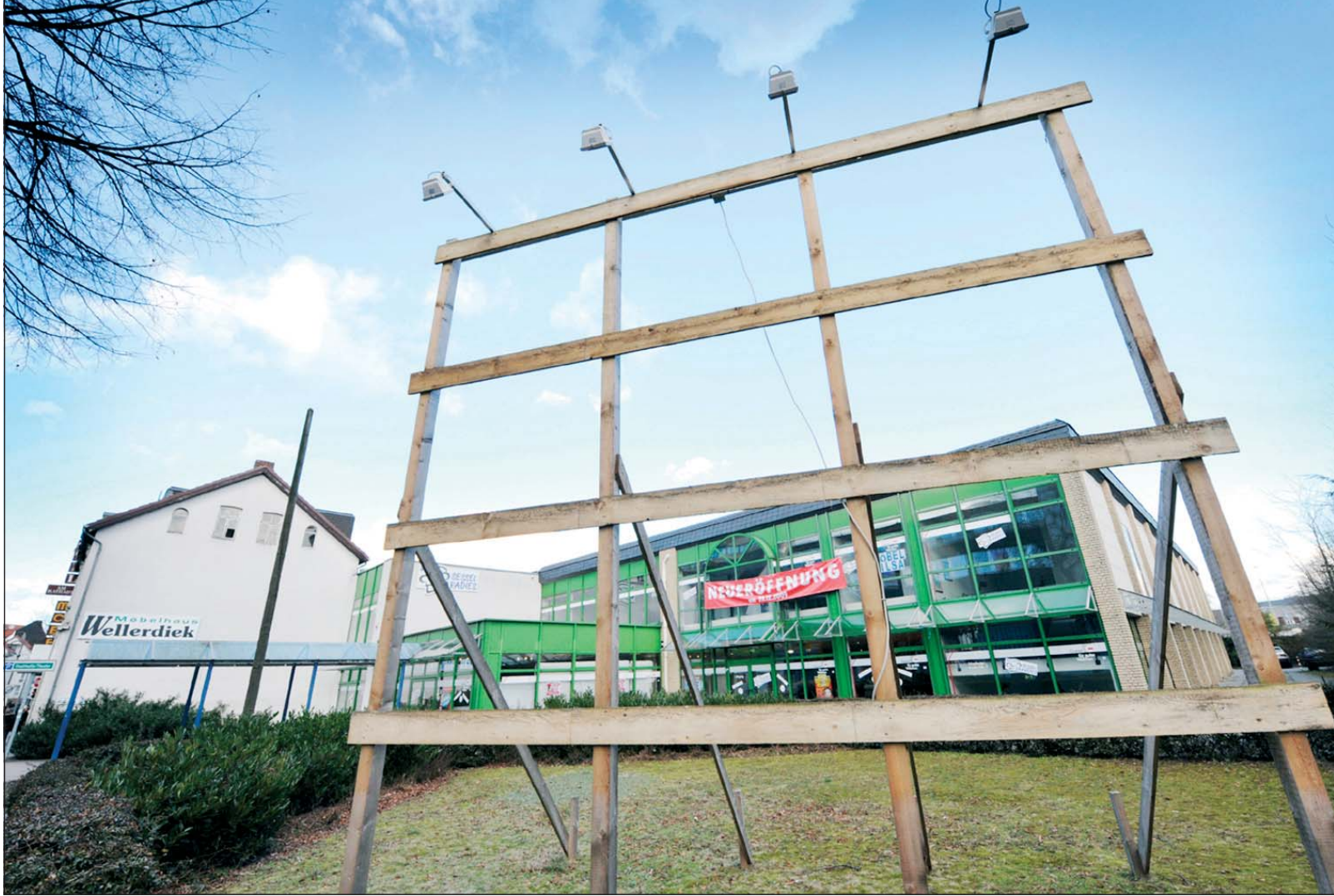
Das gigantische Gazit-Einkaufszentrum ist von heute auf morgen | einem Gerüst, das vor wenigen Tagen noch die Werbetafel für das verschwunden. Zurück bleiben neun quadratisch gerahmte Löcher auf | 100-Millionen-Euro-Projekt trug.