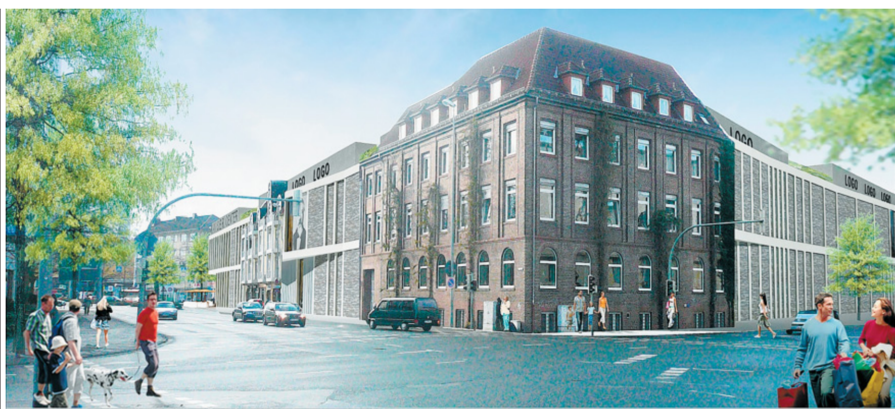
Mit integriertem, ehemaligem Altenheim: Entwurf für das neue Einkaufszentrum in der Innenstadt. Die Fassaden links und rechts davon nehmen die Architektursprache auf.